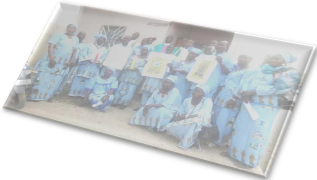
Photo de famille après la messe du lancement du Triennium à N'Djamena

N.B. Exploitation de l'évangile du cinquième dimanche du Temps ordinaire : Mt 5, 13-16.