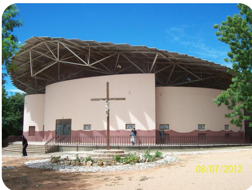
Sanctuaire marial de Figuil – paroisse Mère de Dieu

Révérénd Père Provincial, nous adressons nos sincères remerciements pour tout ce que vous faites pour nous afin que nous puissions mieux connaître Jésus-Christ. C'est aussi une grande joie pour nous chrétiens de Figuil de nous joindre à vous oblats, par votre sens de compréhension pour partager avec vous le charisme de saint Eugène de Mazenod. Quelle grâce pour les fidèles de la zone pastorale de Guider!