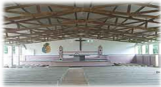
Air sacré de la paroisse Sainte Famille de Tada - Mokolo

Le 05 janvier 2014, ce fut le tour de Mokolo et de la paroisse saint Jean de Maroua le 26 janvier 2014.